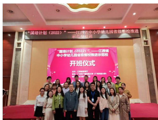
图 鼎昇酒店学员合照（2）