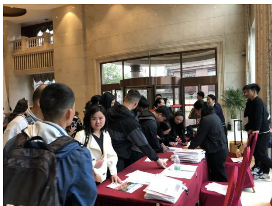
图 报到及领取资料包(鼎昇酒店)