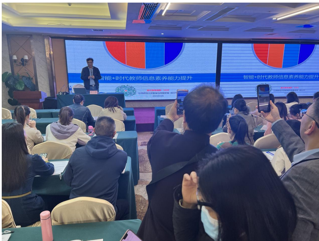
图 君来酒店培训现场剪影（2）