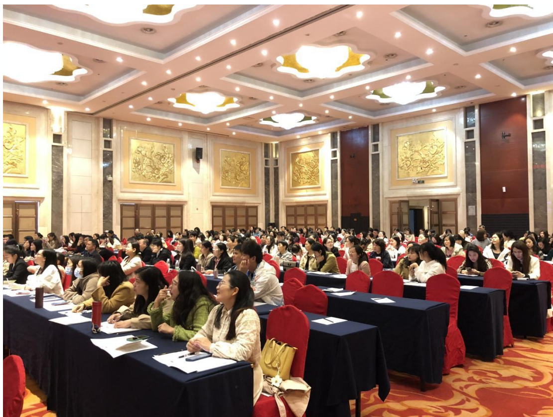
图 鼎昇酒店培训现场剪影（4）