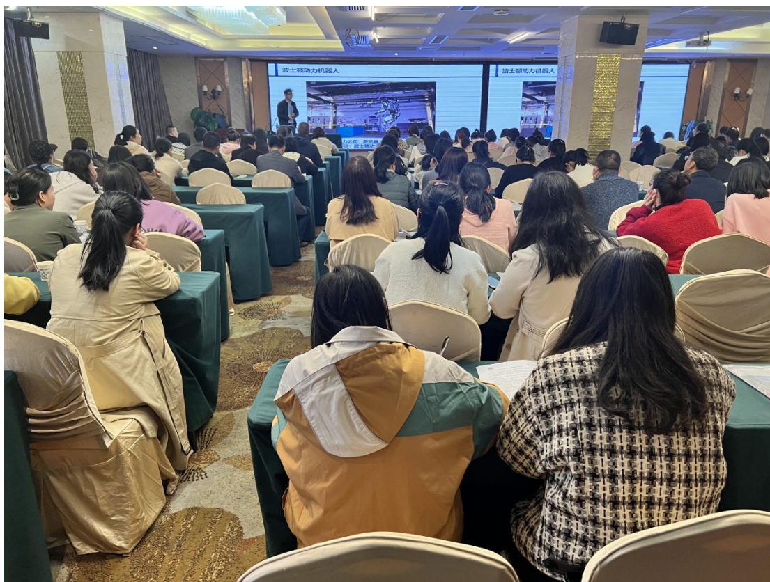
图 君来酒店培训现场剪影（1）