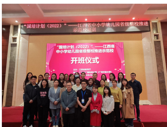
图 鼎昇酒店学员合照（1）