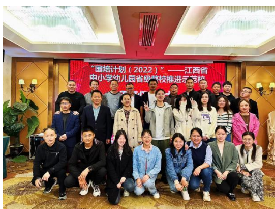
图 君来酒店学员合照（1）