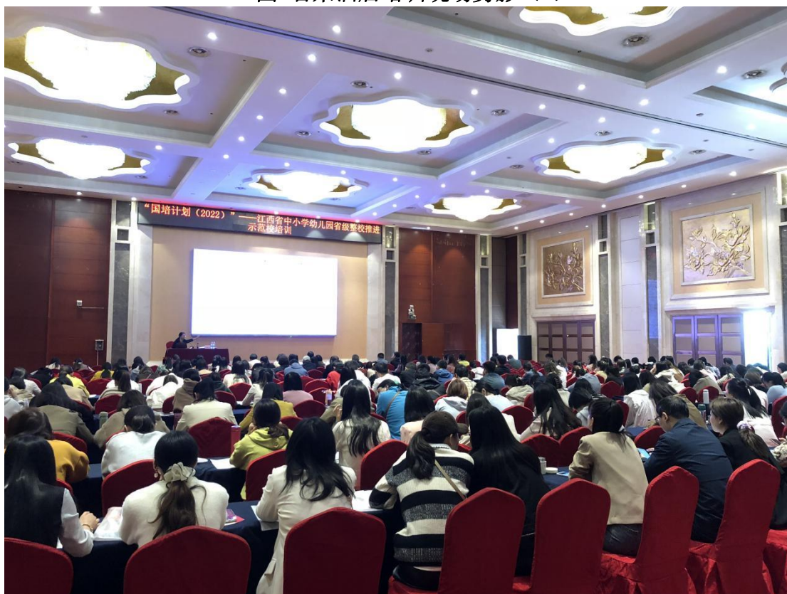
图 鼎昇酒店培训现场剪影（3）