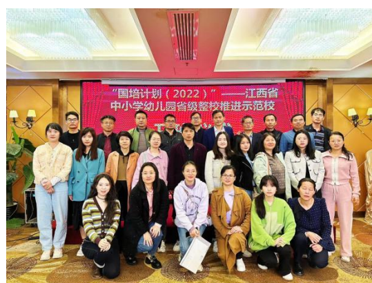
图 君来酒店学员合照（2）