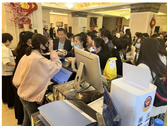
图 学员办理入住（君来酒店）