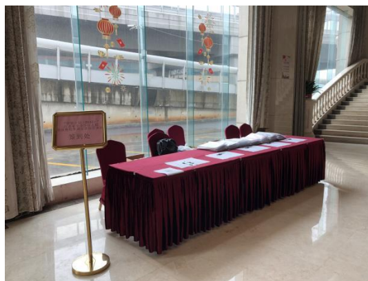
图 鼎昇酒店大堂报到处