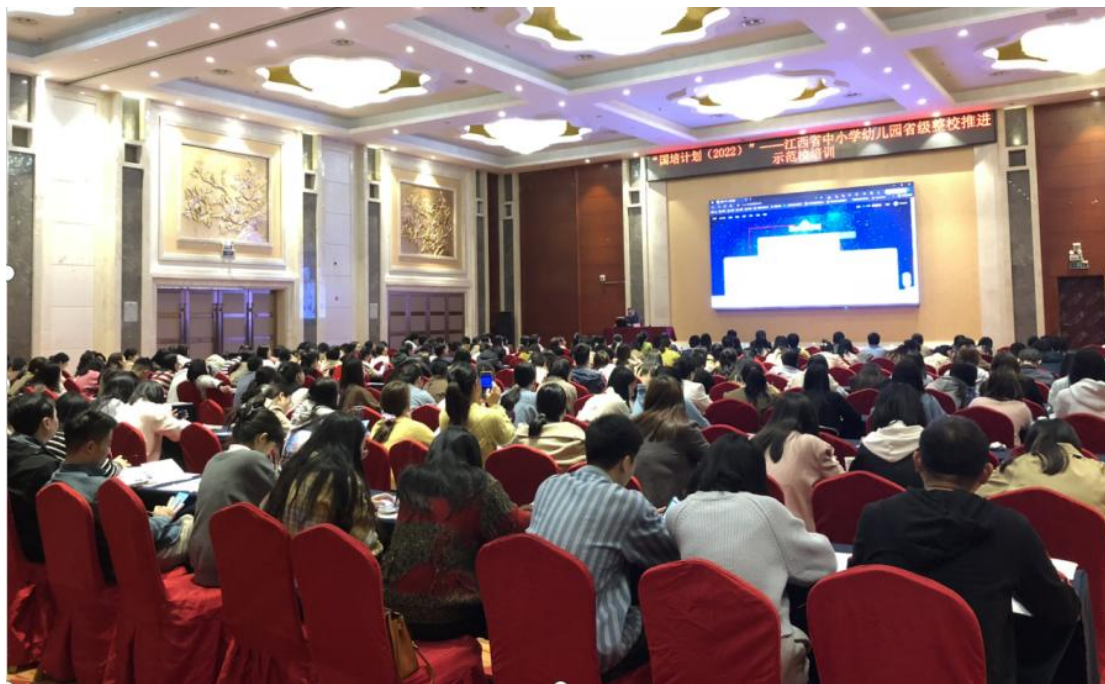
图 鼎昇大酒店培训现场剪影