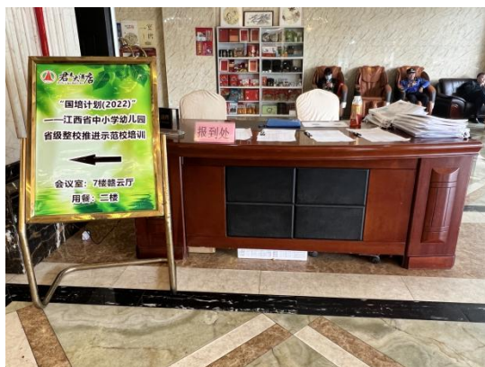
图 君来酒店大堂报到处

2023年4月28日，广州市广播电视大学项目组分别在君来大酒店一楼大堂和鼎昇大酒店一楼大堂，迎接来自江西省5个地市11所学校，共计487名参训学员。他们以校为单位，整校出行，陆续来到报到地点，在项目组的热情指引下，先后完成报到、领取学习资料包并在酒店前台办理入住。