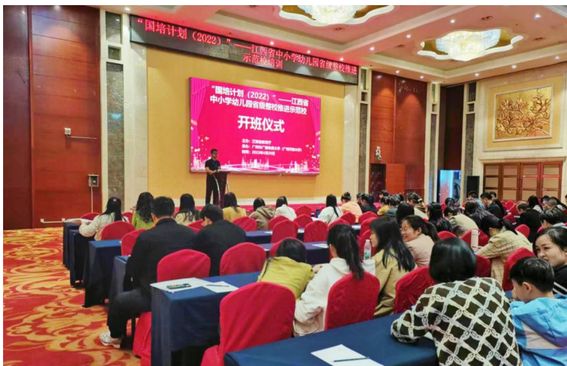
图 鼎昇酒店开班仪式现场