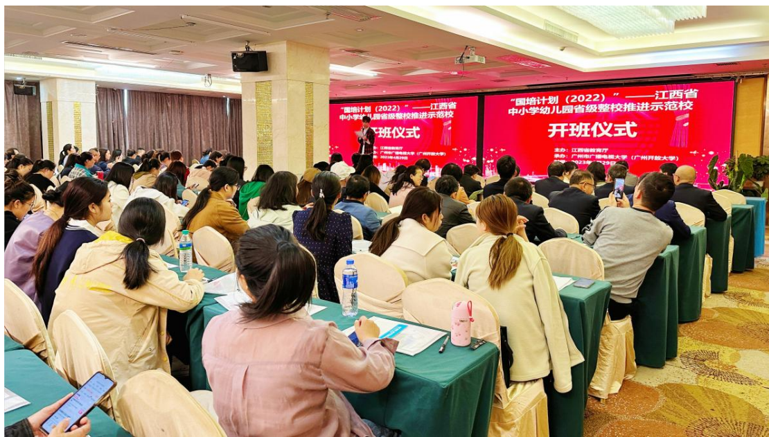
图 君来大酒店培训现场剪影

为贯彻落实教育部、财政部《关于实施中小幼儿园教师国家级培训计划（2021—2025 年）的通知》（教师函〔2021〕4 号）、《教育部关于实施全国中小学教师信息技术应用能力提升工程 2.0 的意见》（教师〔2019〕1 号）、《教育信息化 2.0 行动计划》、《江西省中小学教师信息技术应用能力提升工程 2.0 县区实施指南》、《关于组织实施江西省中小幼儿园教师“国培计划（2022）”的通知》等文件精神和相关要求，由广州市广播电视大学（广州开放大学）承办的“国培计划（2022）”——江西省中小幼儿园省级整校推进示范校集中培训（第二期）于 2023 年 4 月 28 日至 4 月 30 日期间，分别在江西省南昌市君来大酒店会议室和鼎昇大酒店会议室顺利开展。