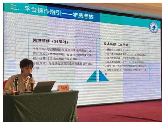
图 毛老师平台讲解（2）