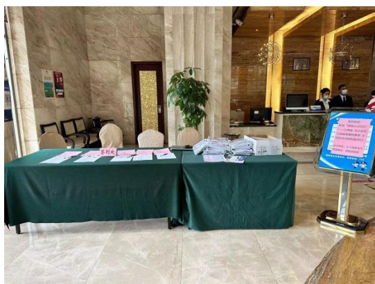
图 酒店大堂报到处

2023 年 4 月 14 日，广州市广播电视大学项目组在南昌市唯客丽晶酒店一楼大堂，迎来了来自江西省 5 个地市的 264 名参训教师，他们以校为单位，整校出行，陆续来到报到地点，在项目组的热情指引下，先后完成报到、领取学习资料包并在酒店前台办理入住。