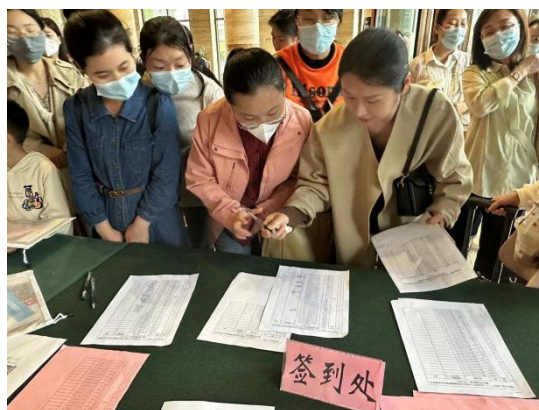
图 报到及领取资料包